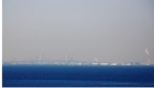
<横浜ベイブリッジ>