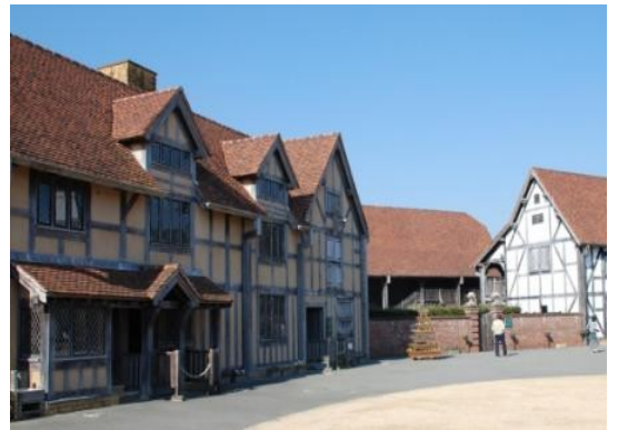
<シェークスピア時代の家並み>

シェークスピア時代を再現した建物と見事なイギリス式の庭園が広がる。ローズマリーにはミツバチが群がっていた。