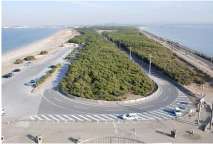
<富津岬の展望台からの展望>