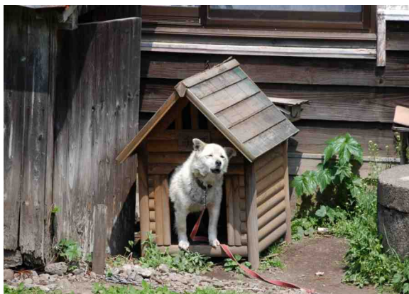
出迎えてくれたワン君