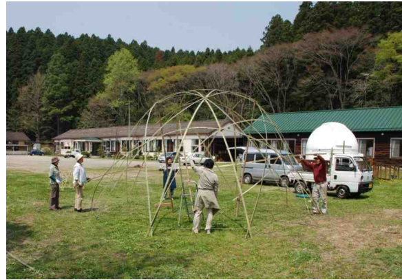
花の祭典(5/10-11 開催)に向け竹でスタードームを作るボランティアの皆さん