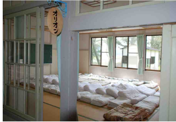
部屋は10名の和室と4名の洋室がある