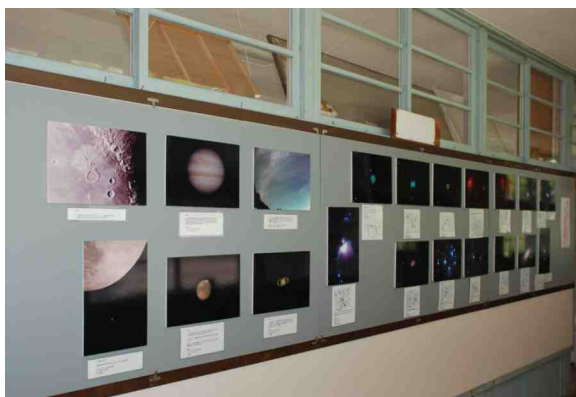
掲示板には35cm望遠鏡で撮った写真が貼られている