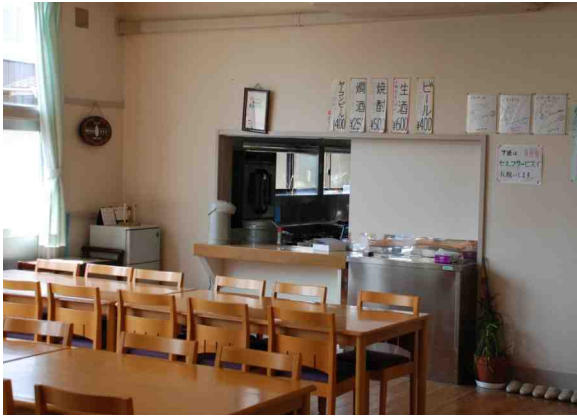
食堂と厨房(元給食室)、アルコールも出る！