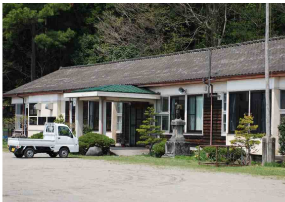
平成11年に廃校となった校舎を利用、玄関横には二宮金次郎や国旗掲揚塔がある。