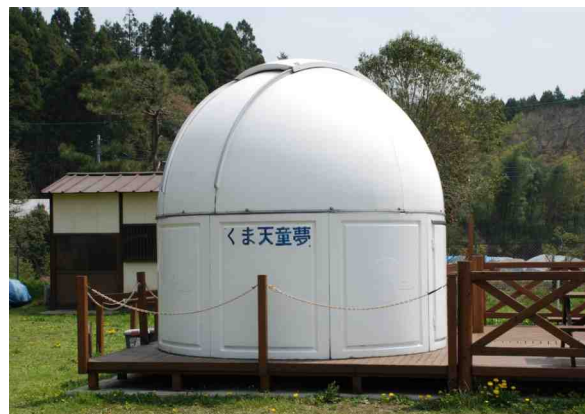
校庭の天体観測ドーム、35cm反射望遠鏡が設置されている