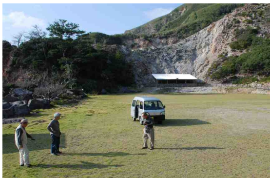
キャンプ場の確認、対面の小屋は砂蒸し温泉