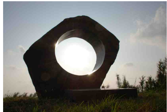
『美女とネズミと神々の島』記念碑