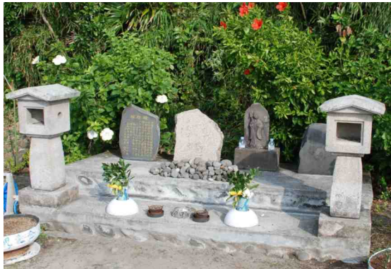
対馬丸慰霊碑 S19.8.2 アメリカ潜水艦に撃沈され沖縄から疎開中の子供 700 名、一般人 1000 名が犠牲になった。