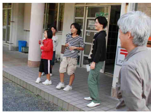
元気そうな島の子供達