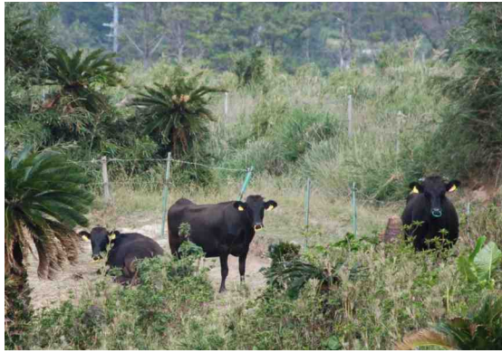
主な産業は牧畜 皆既日食が見られる幸せな牛君たち