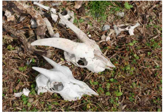
NTT 中継基地の脇にあった野生ヤギのガイコツ