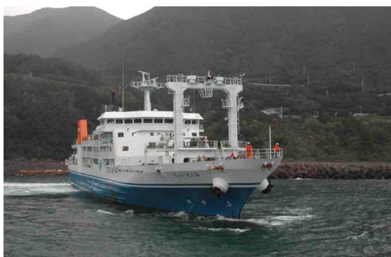
鹿児島と名瀬を結ぶ『としま丸』