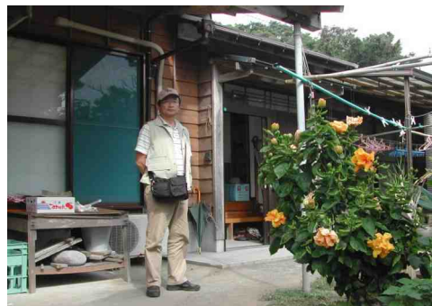
民宿『さかもと荘』の前で Mさん