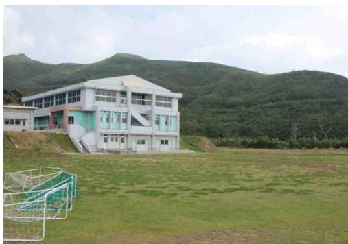
悪石島小/中学校（生徒8人、先生9人）