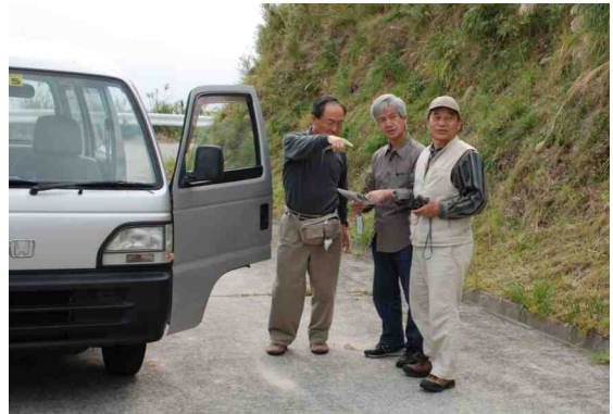
民宿の車を借りて調査活動