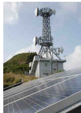
NTT 中継基地と太陽電池パネル