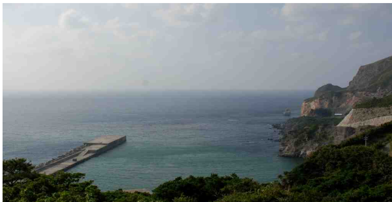
やすら浜港 船が着岸できるのはここだけ