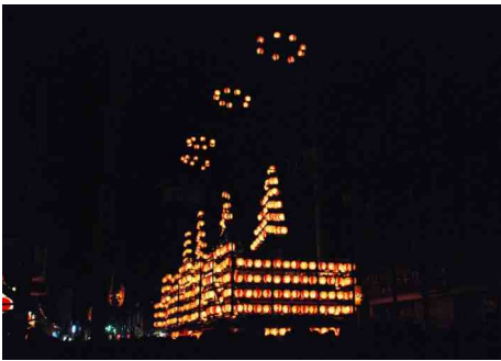
高さ10数m、提灯を付けた太鼓台

10月4～6日は二本松神社の例大祭、各町内から7台の太鼓台が出て引き回される。 特に最終日の夜は本町通りに終結し祭りは最高潮になる。街は熱気に包まれ壮観であった。