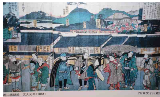
江戸時代、郡山は商業で賑わっていた