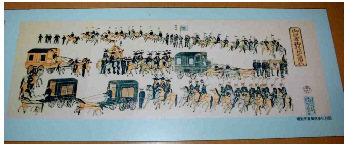
行幸の様子 (この途中小山にも宿泊、その時の記念碑が残っている)