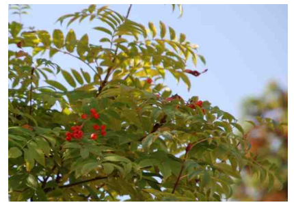
色付きだした庭のナナカマド