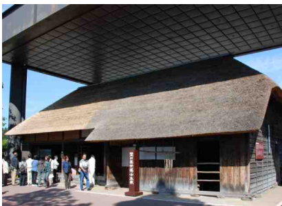
生家 保存のための覆いが重たそう