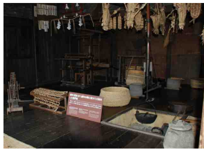
幼少のころ火傷をした囲炉裏