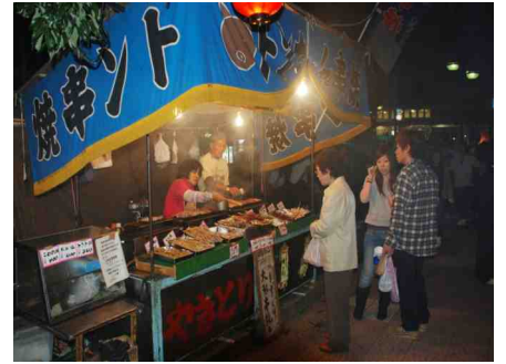
屋台で焼き鳥と生ビールを買う my wife