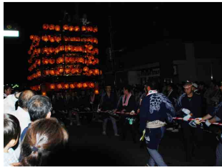
太鼓台を引き回す若連