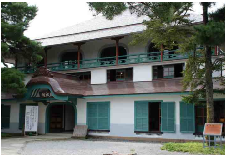
開成館 開拓は国策で進められ、全国各地の旧土族が移住して来た

明治7年に区会所(郡役所の前身)として建設され、安積開拓の核となる『福島県開拓掛』の事務所が置かれた。