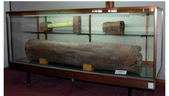
疎水工事で敷設された木製の水道管

明治天皇の東北行幸に際しては行在所(宿泊所)として使われたため、国の史跡に指定され保存されてきた。